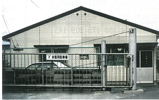
昭和60年に現住所へ移転して、建設した当時の事務所

取得許可 古物商許可/金属くず類回収業者 産業廃棄物収集運搬許可/計量証明事業 産業廃棄物中間処理業許可/エコアクション21 第一種フロン類回収業許可 建設業許可とび・土工