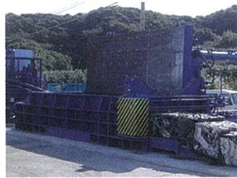
●50PAL型スクラッププレス